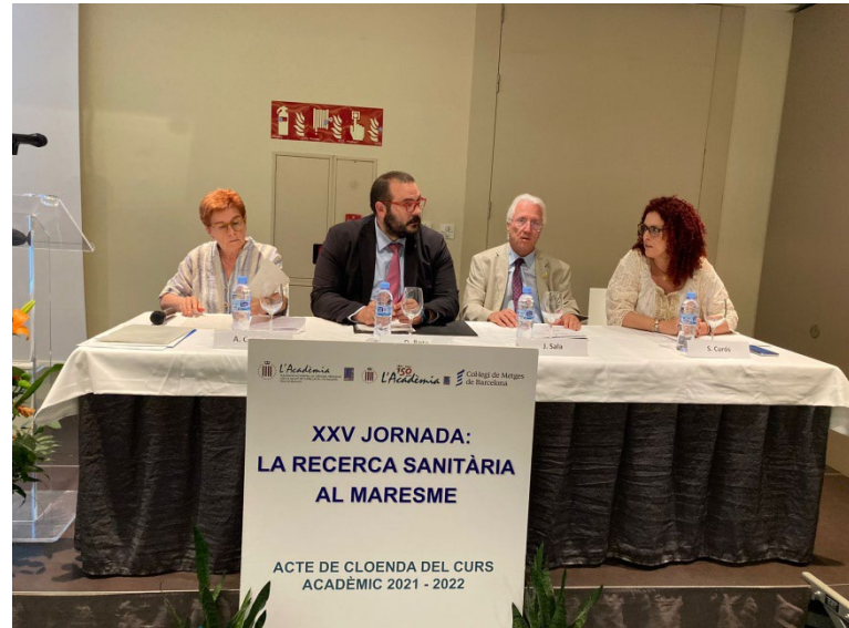
XXV Jornada Recerca Sanitària al Maresme